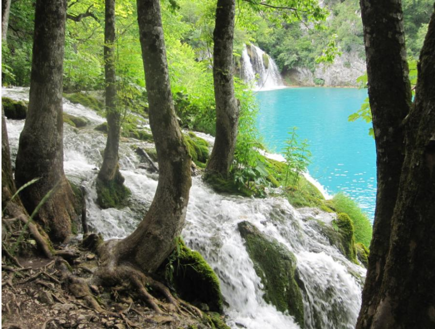
Plitvicka Jezeran kansallispuisto. Kroatia.