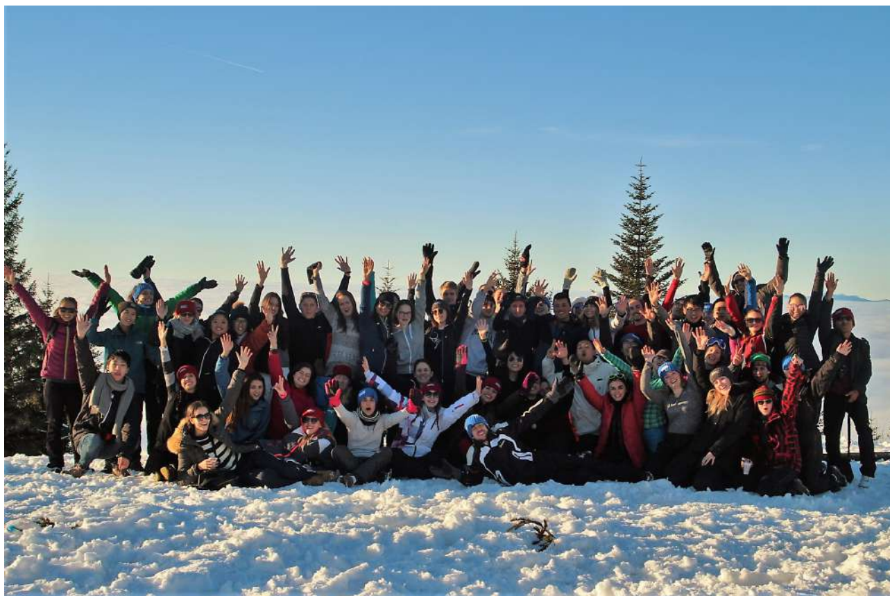
Kuva 10: Introduction Weekendin tunnelmia

Itselläni oli alun perin varauksia Ranskan suhteen vaihtokohteena, lähinnä kielimuurin takia, mutta ne haihtuivat hyvin pian saapumisen jälkeen. Chambéry oli todella kaunis pieni autenttinen ranskalaiskaupunki Alppien vieressä ja voin ehdottomasti suositella paikkaa! Paikalliset olivat lähes poikkeuksetta ystävällisiä ja englannilla sekä ranskan pienillä alkeilla Google Translatella höystettynä pärjäsivät oikein hyvin. Varsinkin jos mielessä on laskettelu, niin tämä kohde soveltuu siihen aivan erinomaisesti. Suurkaupungin vilinää ei kuitenkaan juuri täältä löydy, jos sellainen on enemmän mieleen, vaikka tekemistä silti riitti. Olen itse vaihtooni erittäin tyytyväinen ja kohde sopi minulle todella hyvin. Lopuksi vielä kuva osasta meidän vaihtariporukkaa pilvien yläpuolella La Feclazin Alppimaisemissa!