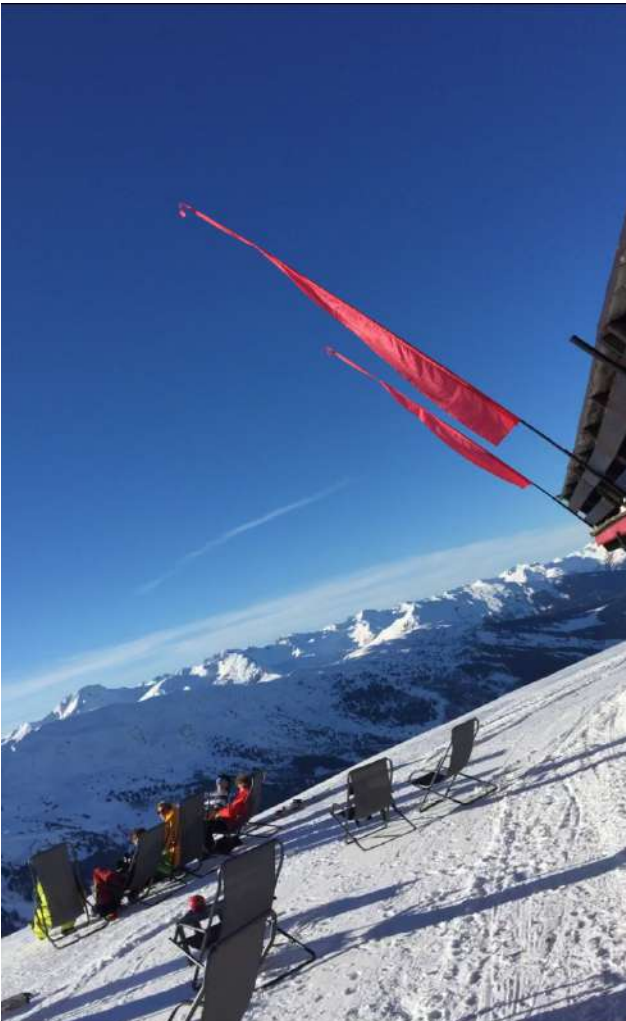
Kuva 7: Méribel

Yliopistolla oli usein erilaisia tapahtumia ja koulun ohella toimi monta organisaatiota, jotka järjestivät vaikka minkälaista puuhaa. Koulun urheiluseuraan SUAPS:iin kannattaa ehdottomasti liittyä! Sen kautta pääsi harrastamaan tai kokeilemaan lähes mitä lajia tahansa. Parasta antia oli kuitenkin jokaisena viikonloppuna järjestetyt laskettelureissut, joiden kautta pääsi tutustumaan Euroopan suurimpiin laskettelukeskuksiin. Reissut kestivät aina päivän, eli bussi Alpeja kohti lähti heti aamulla ja illalla pääsi takaisin Chambéryyn. Vain 20€ suuruinen maksu sisälsi edestakaiset bussimatkat ja koko päivän hissilipun useampaan vierekkäiseen keskukseseen, joten reissut todella olivat hintansa arvoisia. Opiskelijakortilla sai myös suhteellisen halvalla vuokrattua varusteet Chambéryn keskustassa sijaitsevasta liikkeestä. Koulun reissujen kautta tuli koettua muutaman kerran esimerkiksi upeat Méribel, Courchevel ja Val Thorens.