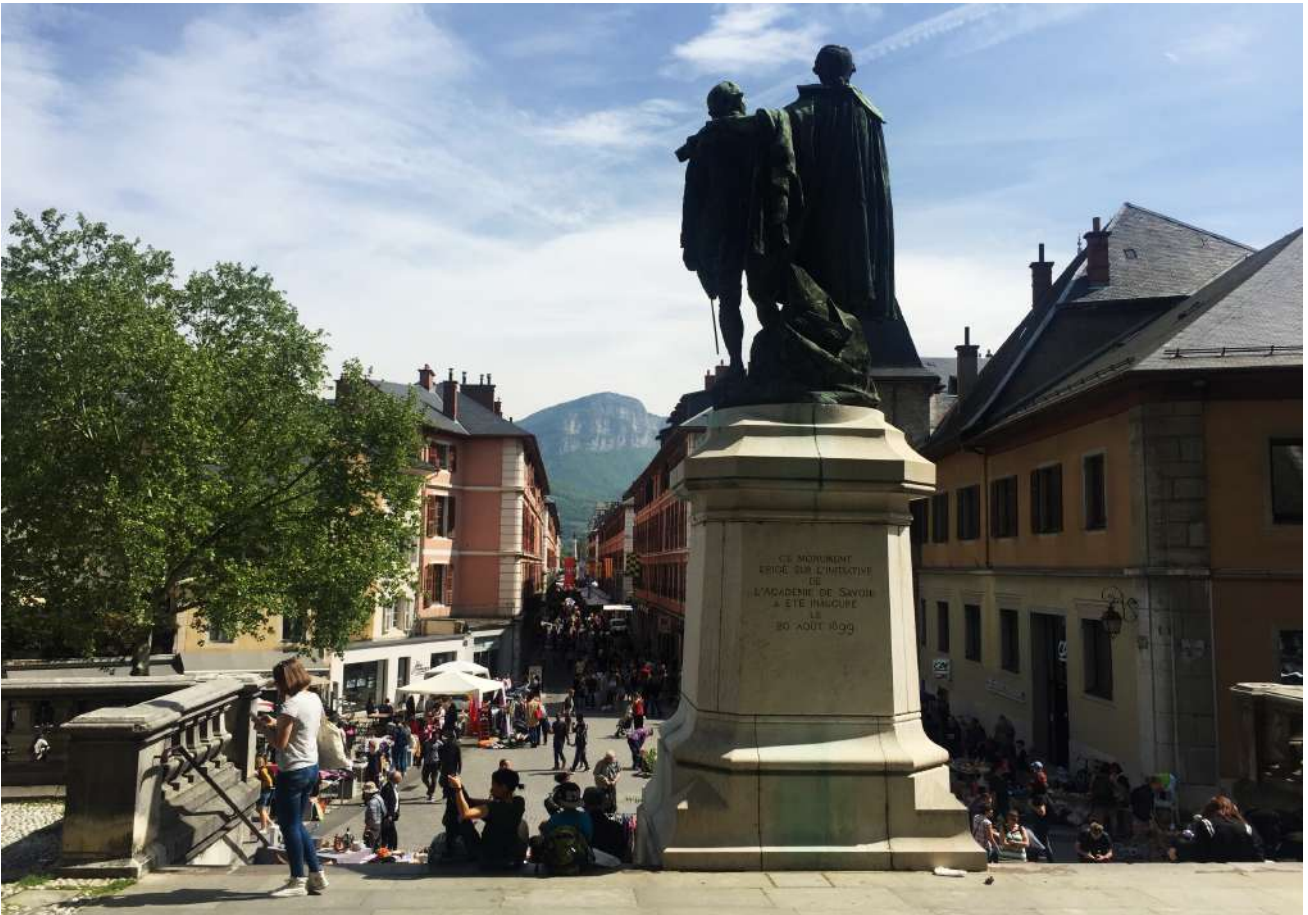
Kuva 1: Chambéryn keskustaa huhtikuussa

Itse Chambéryn kaupunki oli myös todella kaunis ja upeaa luontoa oli aina nähtävillä tai vain pienen matkan päässä. Kaupunki oli kooltaan juuri sopiva: rauhallinen ja kaikki etäisyydet olivat käytännössä kävelymatkan päässä, mutta silti eloisa varsinkin keväisten säiden tullessa, kun paikalliset viettivät päivänsä ulkona terassilla.