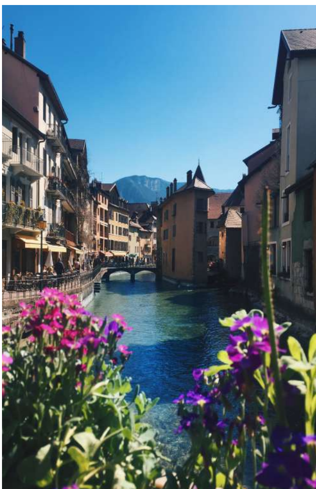
Kuva 8: Annecy

Matkustelu oli myös todella helppoa Chambéryn sijainnin ansiosta. Pelkästään päiväreissulle pystyi lähtemään vaikka minne. Junat kulkivat vaihdon alkupuolella vielä kiitettävästi, mutta sitten iskikin kolmen kuukauden lakko Ranskan rautateillä, jolloin matkustaminen täytyi hoitaa esimerkiksi erilaisten halpabussiyhtiöiden (esim. Flixbus) tai kimppakyytiapin (BlaBlaCar) avulla. Geneven lentokentälle pääsi bussilla tunnissa ja sieltä pääsi halvalla ympäri Eurooppaa, esimerkiksi saimme lennot Roomaan EasyJetillä vain 25 eurolla.