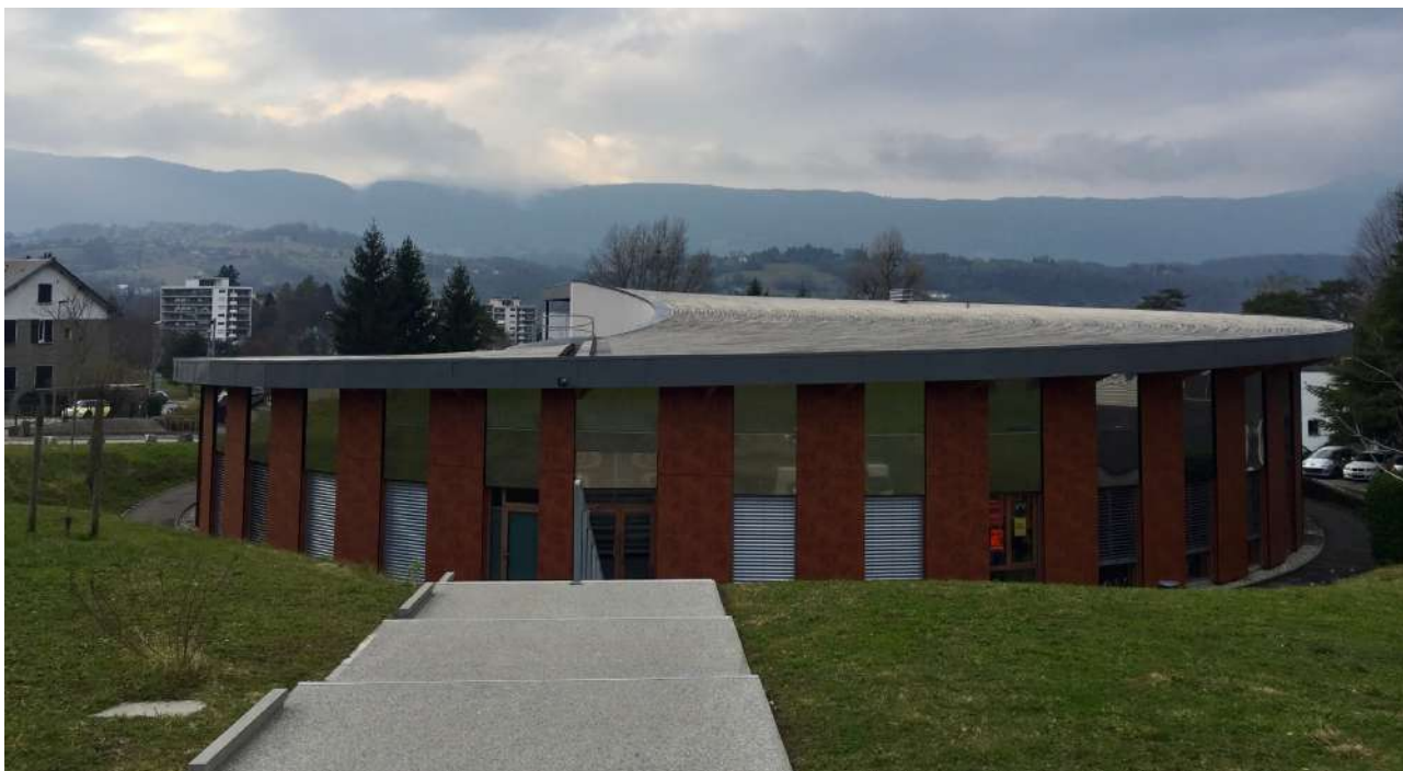
Kuva 4: Yksi yliopiston rakennuksista kampuksella

Université Savoie Mont Blanc on melko iso yliopisto, yli 13 000 opiskelijaa kolmella eri kampuksella kolmessa eri kaupungissa. Chambérystä käsin on mahdollista opiskella joko Jacob-Bellecombetteen tai Le Bourget-du-Lacin kampuksella. Bourgetin kampus oli upean Ranskan suurimman järven rannalla (myös hyvä vapaapäivän viettopaikka!) 8km päässä keskustasta, mutta Jacob sijaitsi keskustassa rinteiden päällä. Itse opiskelin kaikki kurssini Jacobin kampuksella, josta oli noin parin kilometrin matka asunnolleni. Matka oli juuri sopiva kävellä, vaikka ajoittain korkean rinteiden huipulle kiipeäminen aamuisin saattoi hieman ärsyttää. Osa vaihtareista vuokrasi kuitenkin pyörän, joka oli myös hyvä vaihtoehto ja opiskelijoille todella edullinen: koko kevätlukukausi maksoi vain muutaman kympin.