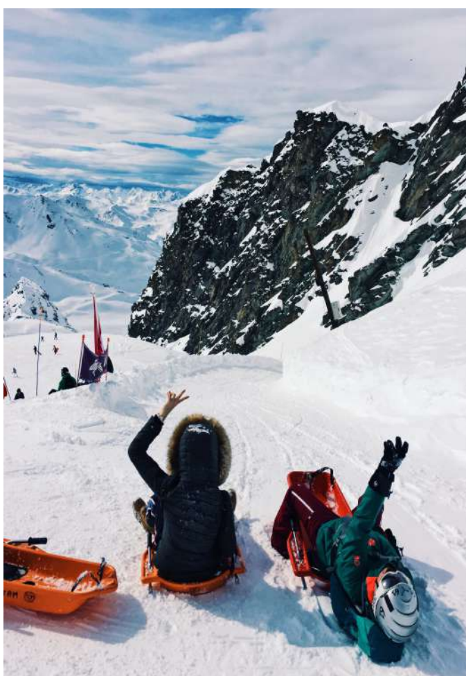
Kuva 9: Val Thorens