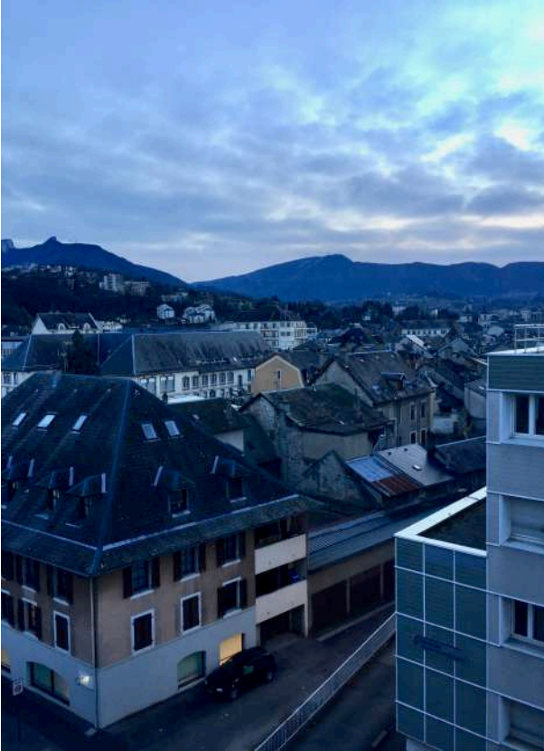
Kuva 3: Näkymät yhden asuntolan ikkunasta