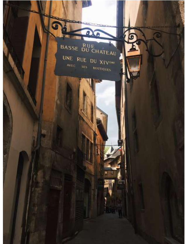
Kuva 2: Chambéryyn vanhaa kaupunkia

Saavuinkin perille 9.1. ja ensimmäinen tervetulotapaaminen Université Savoie Mont Blancin yliopistossa oli 11.1., mutta itse opiskelu alkoi vasta seuraavalla viikolla. Lomaa koulusta oli viikko 8 ja kurssit minun kohdaltani loppuivat jo huhtikuun alkupuolella. Tenttejä kuitenkin oli vielä toukokuun alussa. Opiskelin 22 opintopisteen verran kursseja ja koulua ei ollut joka päivä, mutta läsnäolopakko tunneilla rajoitti osittain elämää. Tunteja tosin oli niin vähän ja harvemmin perjantaisin ja maanantaisin, joten aikaa matkusteluun riitti todella hyvin. Opiskelusta ja matkustelusta molemmista kerron myöhemmissä luvuissa enemmän.