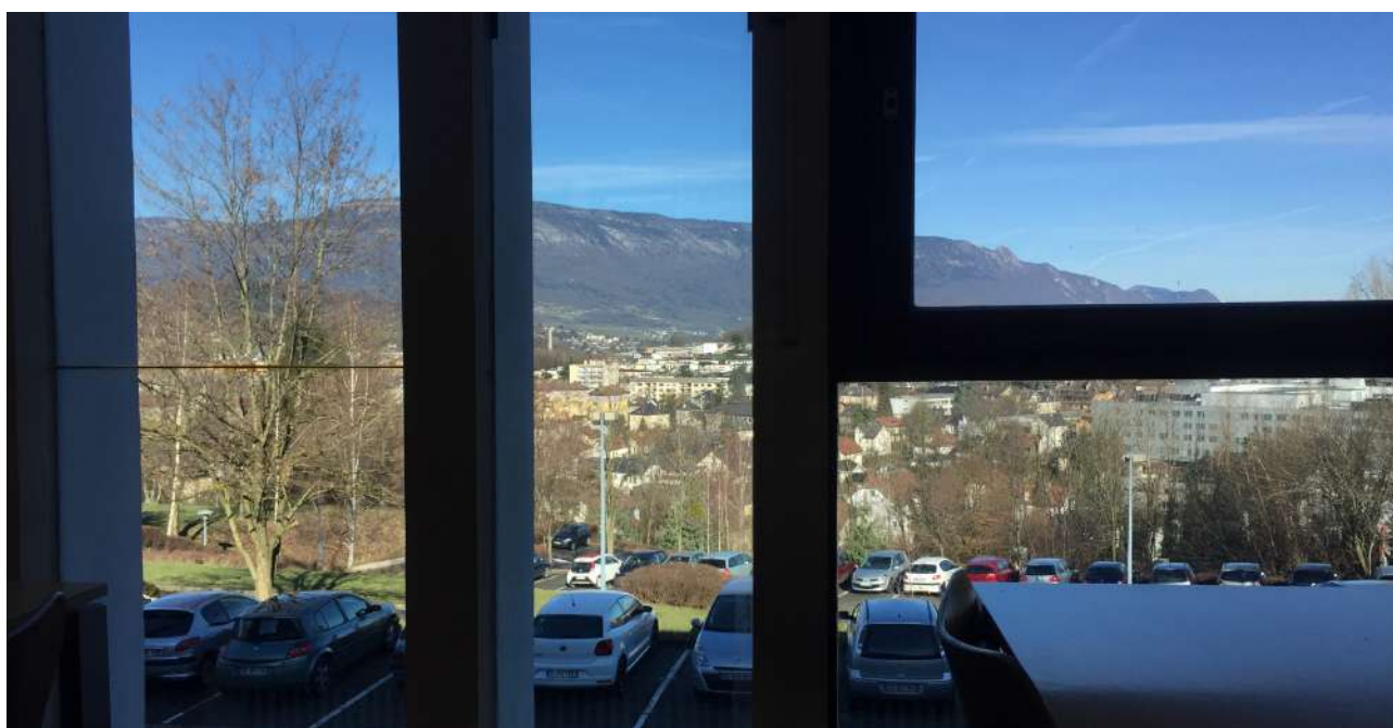
Kuva 5: Opiskelumaisemat koulun kirjastolta

Kampusten rakennusten kunto vaihteli paljon, mutta yleisilme oli suhteellisen rapistunut varsinkin LUT:iin verrattuna. Poikkeuksena oli vain muutama rakennus. Kampukselta näkyvät hienot maisemat kukkulan huipulta kuitenkin korvasivat puutteita.