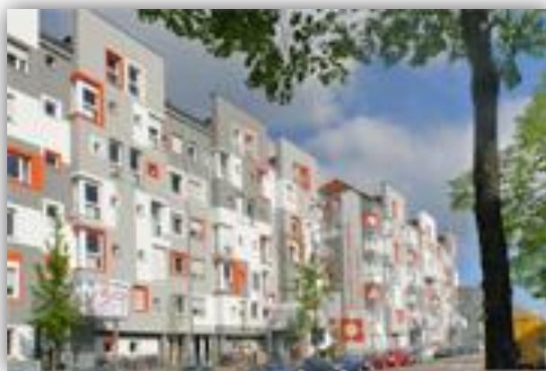
Hafenstrasse, monien vaihto-opiskelijoiden koti.