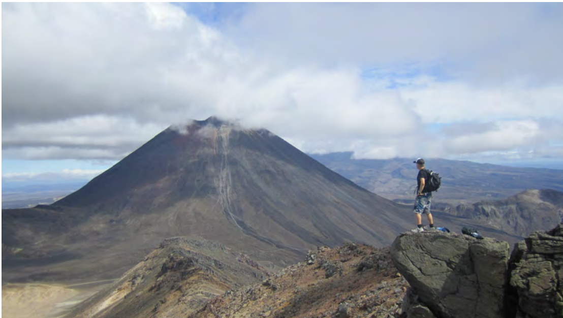
Kuva 6. "Mount Doom".