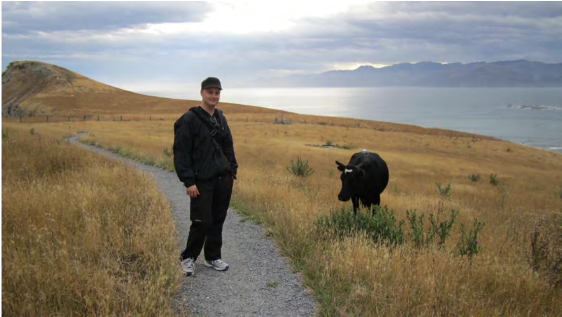
Kuva 1. Kaikoura.