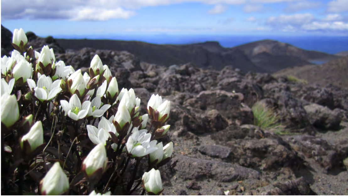
Kuva 5. Tongarino National Park.