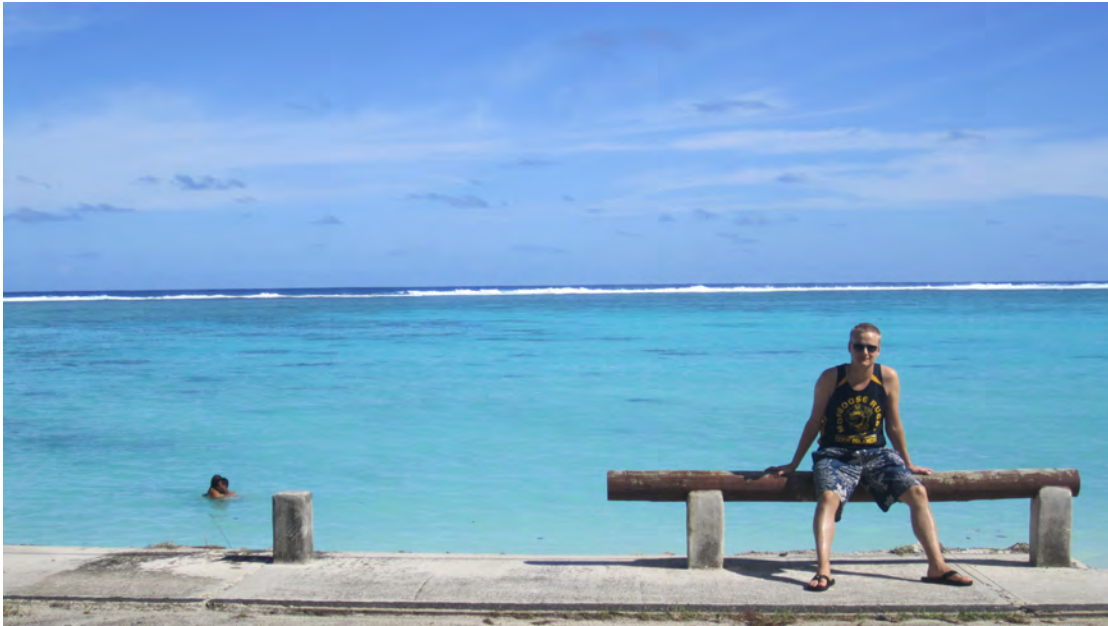
Kuva 7. Cook Islands.