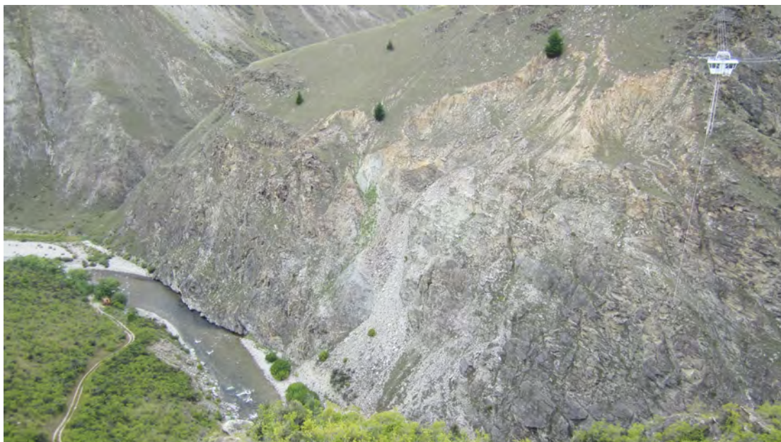
Kuva 3. Nevis Bungy.