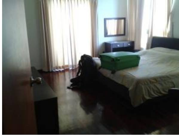
Kuva 3. Suurempi makuuhuone