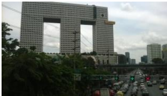
Kuva 1. Elephant Tower

€ korteista, joilla todistimme asuamme talossa). Vuokran päälle tuli vesi, sähkö ja asunnon siivous. Vesi ja sähkö maksoivat noin 80 €/kk. Tällöinkin jouduimme käyttämään säästeliäästi ilmastointia, sillä asuntomme oli noin 100 m 2 suuruinen. Siivous maksoi 7,5 € kerta. Asuntomme sijaitsi norsutornin 24. kerroksessa ja pääsimme muuttamaan sinne heti saapumisemme jälkeisenä päivänä. Tällöin maksoimme käteisellä ensimmäisen kuukauden vuokran sekä samansuuruisen takuuvuokran. Muina kuukausina maksoimme vuokran sekä muut maksut käteisellä norsun alakerrassa työskentelevälle asunnon vuokraajalle. Norsutorni eli Elephant Tower eli Tuk Chang oli hyvä paikka asua. Asunto oli todella upea ja tilava, minkä lisäksi norsutorni on Bangkokin tunnetuimpia rakennuksia ja kaikki taksikuskit tietävät missä se sijaitsee.