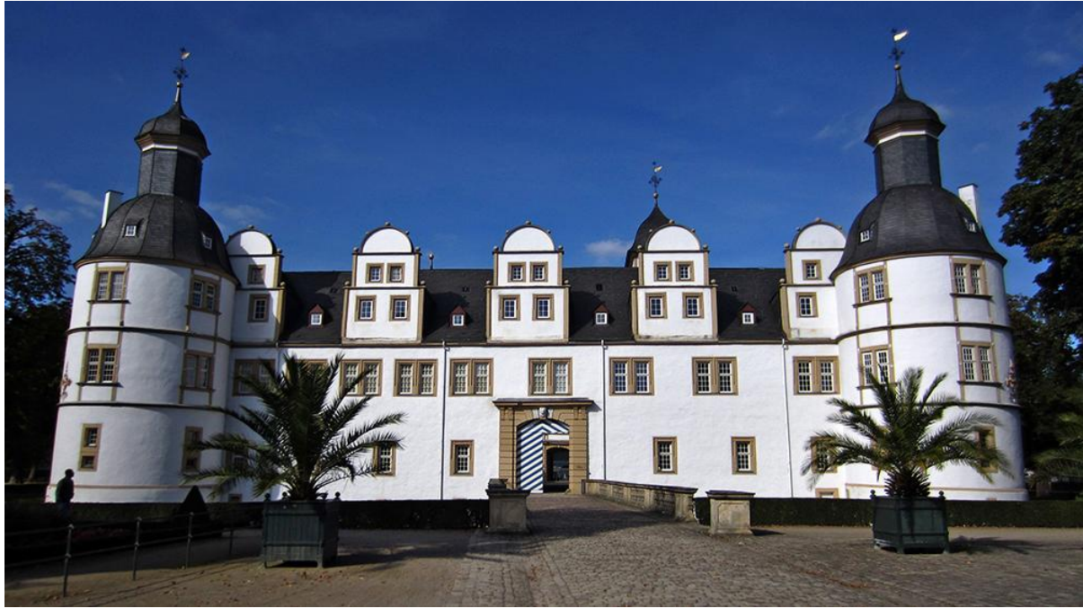
Kuva 1. Schloß Neuhaus, Paderborn.