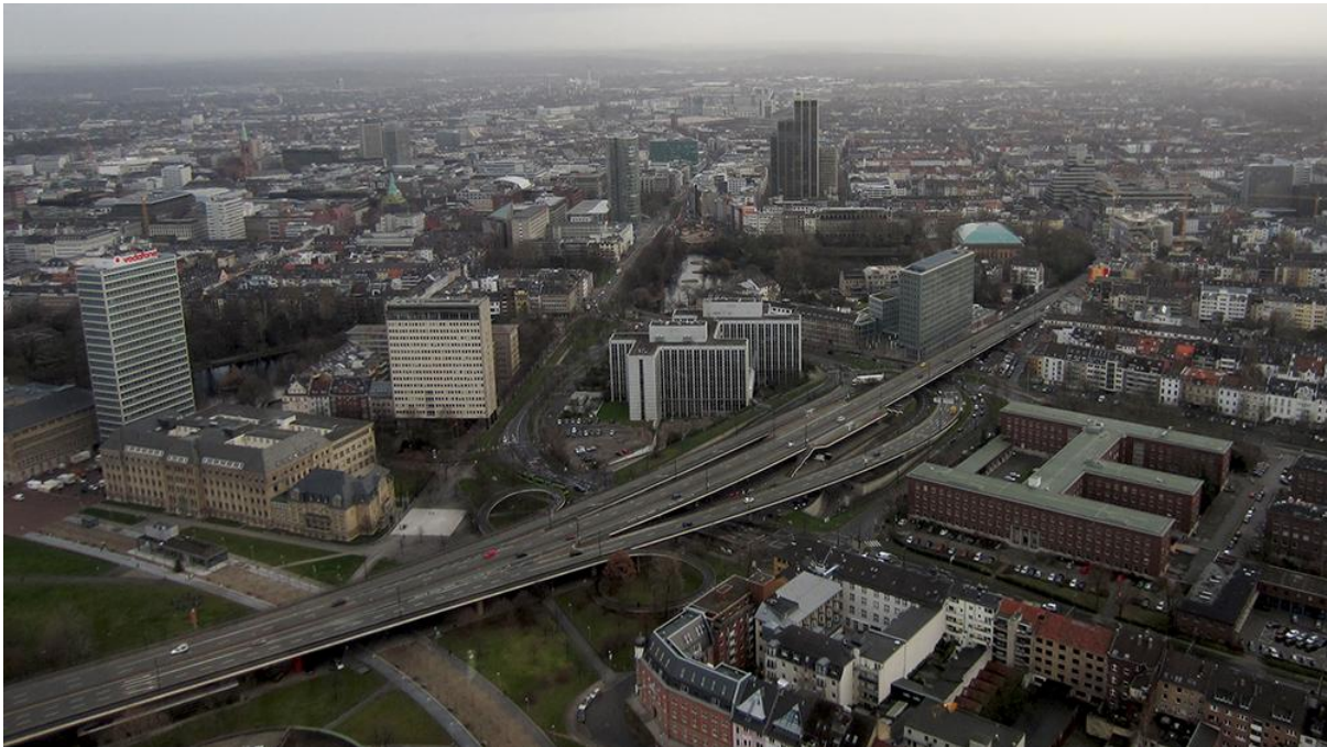
Kuva 3. Maisemaa Düsseldorfin TV-tornista katsottuna.

Bochum, jotka väkiluvultaan sijoittuisivat Suomessa Helsingin jälkeen suurimmiksi kaupungeiksi. Osavaltion keskellä sijaitsee Rein-Ruhrin metropolialue, joka on yksi Euroopan keskeisimmistä taloudellisista alueista. Nordrhein-Westfalen onkin tunnettu juuri Ruhrin teollisuuskeskittymästään. Osavaltion pääkaupunki on Düsseldorf. Düsseldorf on Saksan seitsemänneksi suurin kaupunki väkiluvulla mitattuna ja sijaitsee n. 150 kilometrin päässä Paderbornista. Osavaltion suurin kaupunki on kuitenkin Köln, jossa asuu noin miljoona asukasta. Osavaltiolta löytyy yhteistä rajaviivaa Belgian ja Alankomaiden kanssa, mikä luo hyvät matkailu- ja läpikulkumahdollisuudet edellä mainittujen lisäksi myös Ranskaan. Paderbornista on yleisesti ottaen hyvät junayhteydet suurimpiin Saksan kaupunkeihin sekä kattavat lentoreitit mm. Düsseldorfin kansainväliseltä sekä halpalentoyhtiö Ryanairin käyttämältä Düsseldorf Weezen lentokentältä.