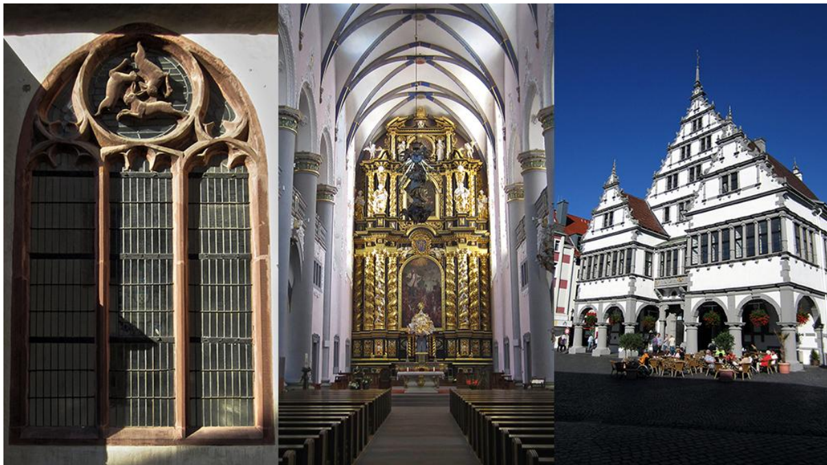
Kuva 2. Das Dreihasenfenster, Marktkirche Paderborn ja Rathaus.

Paderborn sijaitsee Nordrhein-Westfalenin osavaltiossa, joka on Saksan suurin osavaltio väkiluvulla mitattuna. Alue on kooltaan 34 084 km 2 ja siellä asuu liki 18 miljoonaa ihmistä, mikä tekee alueesta yhden Euroopan tiheimmin asutetuista. Suuren asukasmääränsä johdosta alueelle onkin muodostunut neljä Saksan kymmenestä suurimmasta kaupungista; Köln (4.), Düsseldorf (7.), Dortmund (8.) sekä Essen (9.). Osavaltion alueella ovat myös mm. Duisburg ja