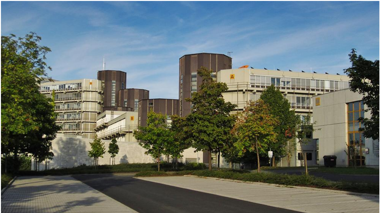
Kuva 5. Universität Paderborn.

viettoon niin hyppytunneilla kuin ilta-aikaankin. Paikka on sisustettu viihtyisäksi oikean pubi-hengen mukaisesti, joten siellä oleskelee mielellään kahvikupposen tai olut-tuopin äärellä.