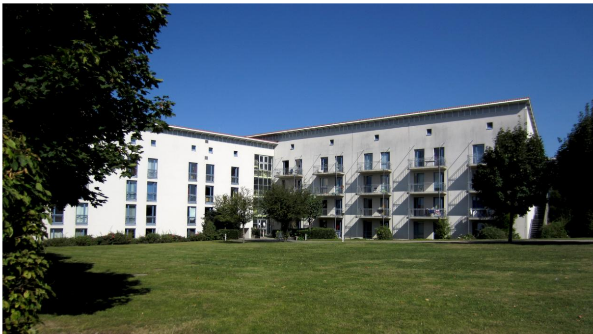
Kuva 4. Yksi Vogeliuswegin asuntoloista.

Me majoituimme vaihtoajaksemme Vogeliuswegin soluasuntolaan. Aiemmista matkakertomuksista poiketen asuntola oli kuitenkin suuri pettymys siisteydeltään ja yleisilmeeltään. Yleiset tilat olivat suomalaisesta näkökulmasta katsottuna järkyttävässä kunnossa, eikä oma huonekaan siisteydellään positiivisesti yllättänyt. International Officesta vakuutettiin, että ongelmat siisteyden osalta ilmenivät ensimmäistä kertaa ja jatkossa tähän asiaan tultaisiin puuttamaan entistä tarkemmin avaimia pois luovutettaessa. Huoneet olivat kuitenkin varsin tilavia ja asuntojen sijainti oli ideaalinen lähellä yliopistoa, suurta Südring Center -kauppakeskusta sekä vaihto-opiskelijoiden kokoontumispaikkana suosittua Eurobiz Officea. Paderbornin keskustakin on Vogeliuswegiltä katsottuna sopivan kolmen kilometrin kävelyetäisyyden päässä sekä bussiyhteydet keskustaan ja lähialueille liikennöivät viereiseltä kadulta. Myös Internet-yhteys, jonka käyttötunnukset saa noudettua asuntotoimistosta saapumisen jälkeen, toimi asunnoissa mainiosti. Opiskelijoiden liikuntamahdollisuudet urheilu- ja jalkapallokenttineen sekä kuntosaleineen sijaitsevat yliopiston ja Vogeliuswegin lähellä.