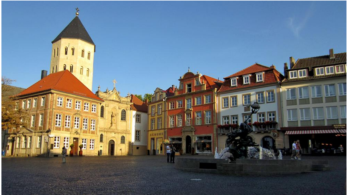
Kuva 7. Domplatz, Paderborn.

hinta-laatu -suhteeltaan loistava kiinalainen buffet-ravintola Phönix sekä Pader Bowl, jossa kävimmekin pariin otteeseen viettämässä iltaa keilauksen ja biljardin parissa. Ravintoloista suosikiksemme muodostui Feuerstein, jossa on mukava viettää iltaa vaikka sitten pelkän olutuopin äärellä. Paikan ruoatkin ovat erinomaisia ja kohtuuhintaisia.