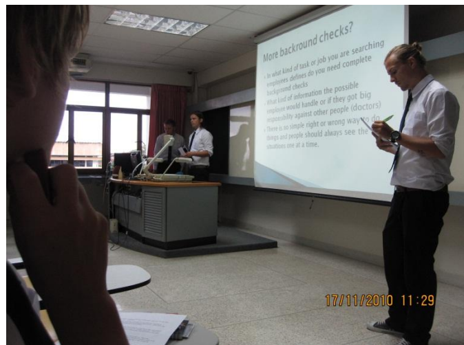
1. Esitelmän pitoa

AE Phuketin Prince of Songkla vaihto-ohjelmasta löytyy reilut kymmen kurssia, joista valitaan 3-4 mieleisintä. Valittavat kurssi löytyvät AE:n nettisivuilta. Omiin valintoihini kuului Leadership, Principle of Marketing, Human resources ja Thai food preparation. Olin kuulut joistakin lähteistä, että Aasian kurssien taso on paljon huonompi kuin Suomessa ja saattavat tuntua suomalaisista opiskelijoista pilipalikusseilta. Tämä väite osoittautui kuitenkin epätodeksi ainakin Prince of Songklan kohdalla. Kurssit yllätivät minut vaatavuudellaan. Jokainen kurssi sisälsi 80% läsnäolopakon, lukuisia case-tyyppisiä harjoituksia (Thai food -kurssia lukuun ottamatta), esseitä ym. Opiskelu materiaali oli myös laadukasta. Luennoitsijat olivat hyviä; mielenkiintoisia kuunnella, selkeitä ja esittivät asiat johdonmukaisesti. Mukaan tosin mahtui yksi poikkeuskin.