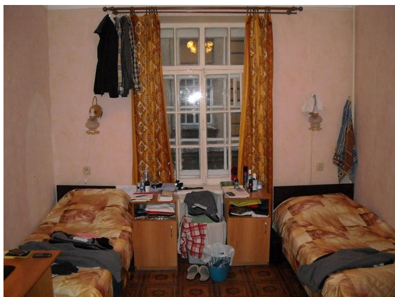
Kuva 2. Huoneemme asuntolassa.

Asuntolalla meidän piti täyttellä lappuja ja maksaa heti 500 ruplaa pesukoneiden, veden, sähkön, netin ja muun vastaavan käytöstä. Tämän jälkeen meille annettiin lasku huoneesta, joka oli 100 ruplaa/yö eli 3000ruplaa/kk → alle 100€/kk.