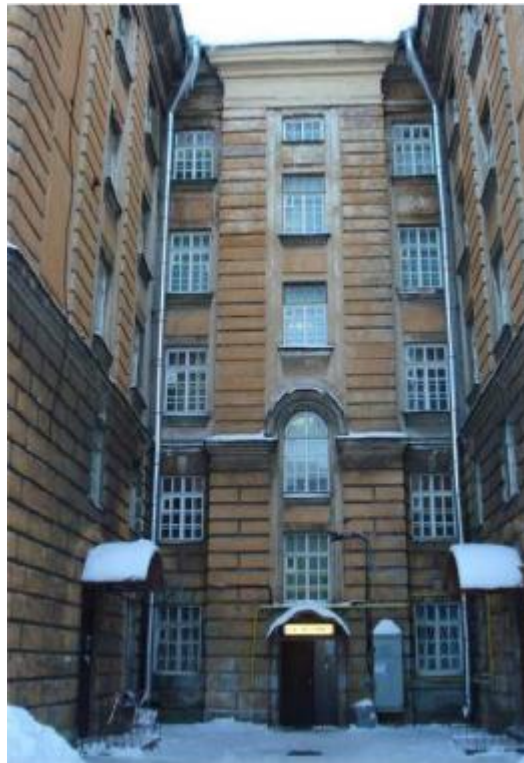
Kuva 1. Asuntola yliopiston porttien sisäpuolella.

Asuntolalla meidän piti täyttellä lappuja ja maksaa heti 500 ruplaa pesukoneiden, veden, sähkön, netin ja muun vastaavan käytöstä. Tämän jälkeen meille annettiin lasku huoneesta, joka oli 100 ruplaa/yö eli 3000ruplaa/kk → alle 100€/kk.