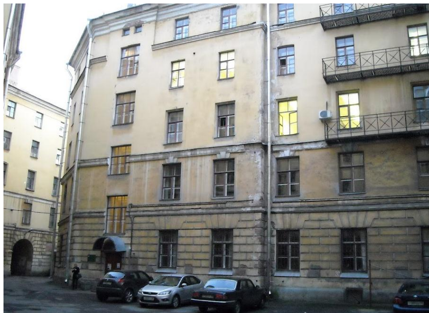
Kuva 6. Kielikeskuksen rakennus.

Aineopinnot alkoivat vasta noin kuukauden kuluttua vaihtoon tullessa ja ne olivat yleensä viikon kestäneitä intensiivikursseja. Luennot kestivät yleensä 4h ja niitä oli viikossa 4-5 kertaa, jolloin ne olivat todellakin intensiivisiä. Kurssit luennoitiin englanniksi, jos valitsi englanninkielisiä kursseja ja luennointitaso oli vaihteleva. Kurssin lopuksi oli ehkäpä jonkinlainen näennäinen tentti, riippuen kurssista, jonka läpäisi melko kivuttomasti. Kurssien huoneista ilmoitettiin aina joka viikko erikseen ja yleensä luennot olivat kielikeskuksen rakennuksessa eivätkä päärakennuksessa. Eri luennoitsijat keräsivät listaa paikalla olevista, mutta kaikissa tapauksissa paikalla ei edes tarvinnut olla, kunhan oli tentissä paikalla.