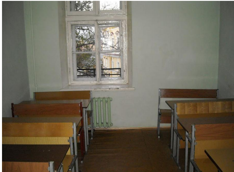
Kuva 7. Tyypillinen luento”sali”.

Luentomateriaalina toimi yleensä wikipedia ja luokkahuoneet olivat erittäin pienet sekä ilman minkäänlaisia mukavuuksia.