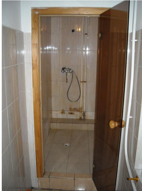
Kuva 3. Suihku.

Huoneen kunto ja sisältö oli parempi mitä odotin, koska siellä oli jopa jääkaappi käyttöömmme. Tämä oli toisaalta myös huono asia, koska se piti melko kovaa ääntä öisin. Asuntolassa oli viisi kerrosta ja jokaisessa kerroksessa oli kaksi puolta, jossa 14 huonetta, kaksi vessaa, yksi suihku, keittiö sekä ”olohuone”. Olohuoneessa oli sohvia muutama kappale sekä televisio.