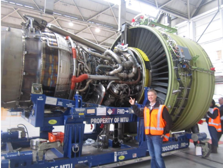
Kuva 2. Boeing 777-300ER suihkuturbiini ja komponentit sen peltien alla.

laajentaa omaa näkökenttää huomattavasti ja antaa uuden näkökulman tarkastella valmistustekniikkaa.