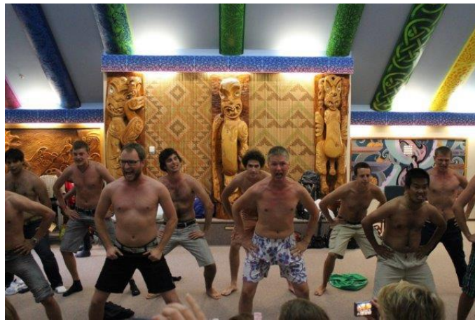
Kuva 1. Maorien sotatanssi Haka