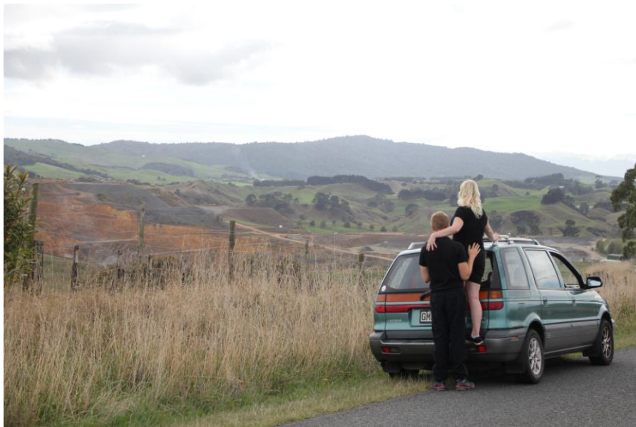
Kuva 3. Lahnaksi huikean suorituskyvyn takia nimetty automme.

Uudessa-Seelannissa on paljon vuokra-autoyrityksiä ja auton vuokraaminen on kilpailun ansiosta suhteellisen halpaa. Kuitenkin oman auton hankintaa kannattaa harkita, jos on tarkoitus kiertää koko Uusi-Seelanti ympäri. Itse matkustimme lähes jokaisena viikoloppuna sekä lomilla ja koko Uusi-Seelanti tuli kierrettyä. Hankimme siis kihlattuni kanssa oman, seitsemän hengen tila-auton (kuva 3), johon mahtui kaksi ihmistä nukkumaan kaatamalla penkit. Maksoimme autosta $1250 ja saimme sen myytyä hintaan $1390. Vaikka jouduimme katsastamaan auton, maksamaan vakuutukset ja tekemään perushuoltoja, laskimme, että itse auto tuli maksamaan meille 13 000 km ajon jälkeen vain noin $550. Vastaavalla rahalla saisi vuokrattua vastaavankokoisen auton viideksi päiväksi. Vaikka autoa emme olisi saaneet myytyä, olisimme säästäneet paljon rahaa verrattuna siihen, että olisimme vuokranneet auton. Suosittelen lämpimästi ostamaan oman auton vaikka kaveriporukassa, jolloin säästää sievoisen summan rahaa ja reissuun lähteminen on paljon helpompaa. Myöskään matkustamisista ei tarvitse suunnitella niin aikaisin ja huonon sään sattuessa matkaa voi siirtää ilman kustannuksia. Bensan hinta oli euroissa noin 1,4 matkamme aikana ja bensakulut pienenevät porukalla matkustaessa.